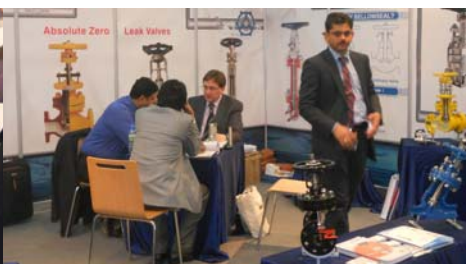
Estand de Bell O Seal