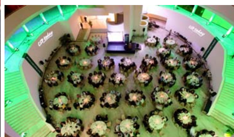
Arriba: Sala de Conferencias Abajo: Cena de entrega de los Csp Awards

Schubert & Salzer se consolida dentro del sector termosolar como Mejor Suministrador de Componentes para Plantas Termosolares . Este premio es fruto de la calidad de los productos que ofrece nuestra empresa, sumado al Know-how y el buen Servicio que nos caracteriza. El equipo que integra Schubert & Salzer agradece este reconocimiento a su profesionalidad, esfuerzo y constancia.