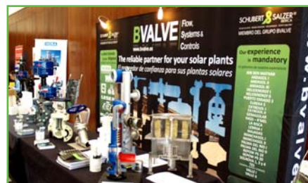
2 Estand Schubert