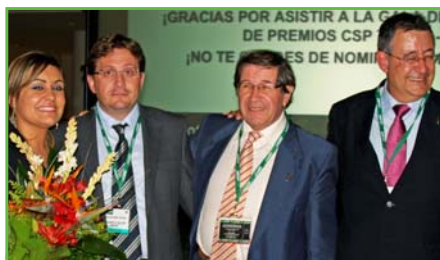
1 Éxito de Schubert en la Cumbre Termosolar