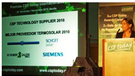
Momento de las nominaciones

A la presente edición de la Cumbre Termosolar acudieron más de 600 asistentes de 30 países y en ella se trataron temas de competitividad, innovación, bancabilidad y oportunidades de mercado. Representantes de las empresas termosolares más importantes a nivel mundial y empresas vinculadas al sector eligieron con su voto a las mejores compañías en cada categoría.