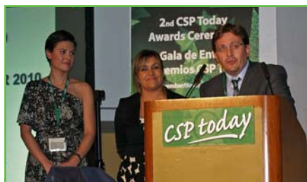
1 Schubert: premio mejor proveedor