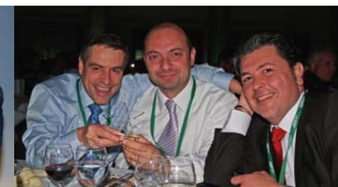
Nuestro equipo celebra el reconocimiento